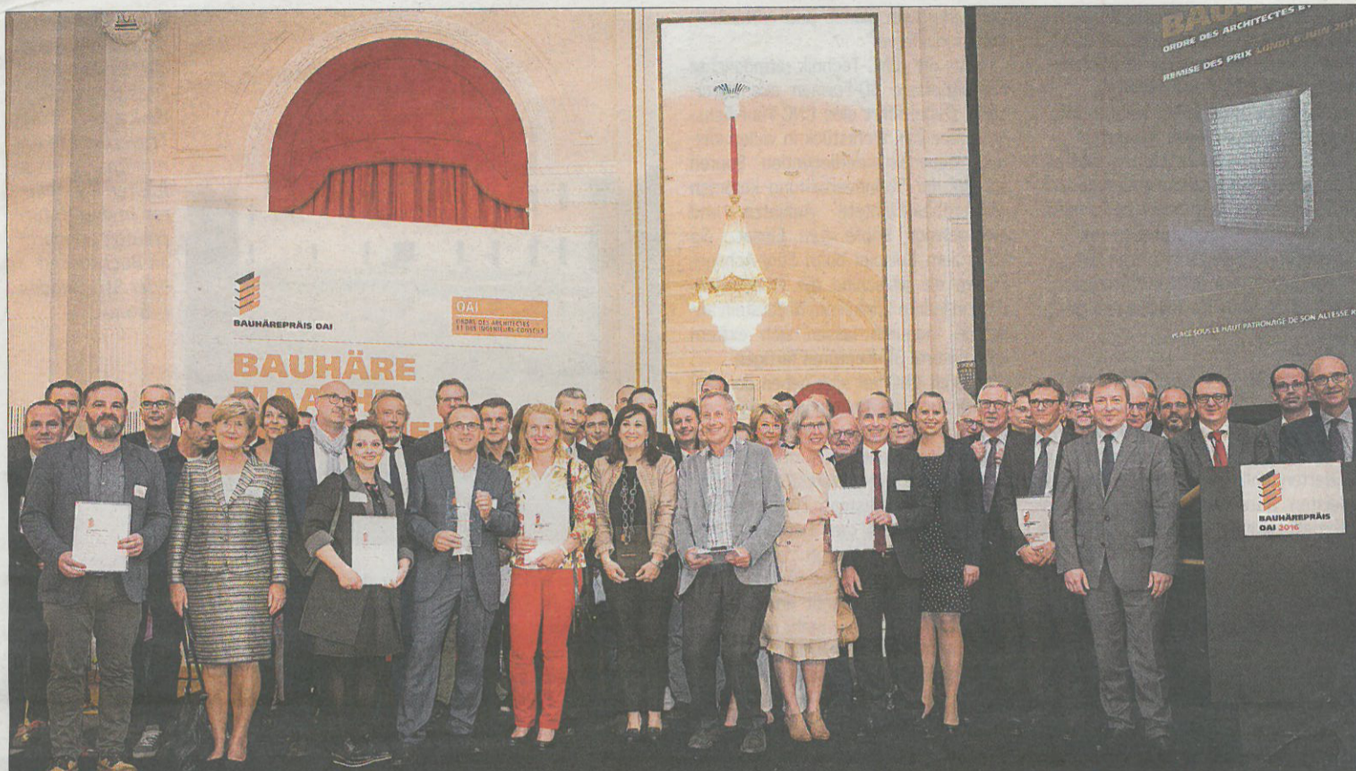
Parmi 317 projets remis, 16 lauréats ont été récompensés pour leur créativité.

Le jury a souligné la quantité étonnante de réponses à l'appel et surtout la large qualité impressionnante des projets remis.