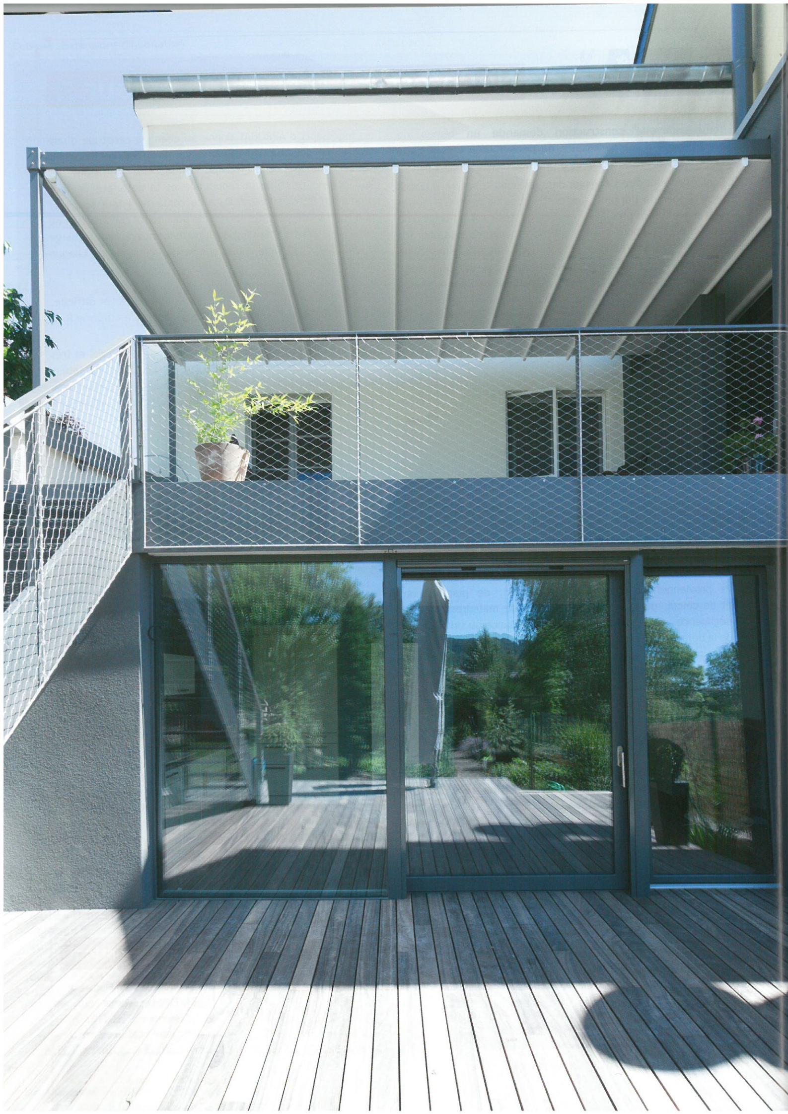
Extension avec terrasse couverte (ou non)