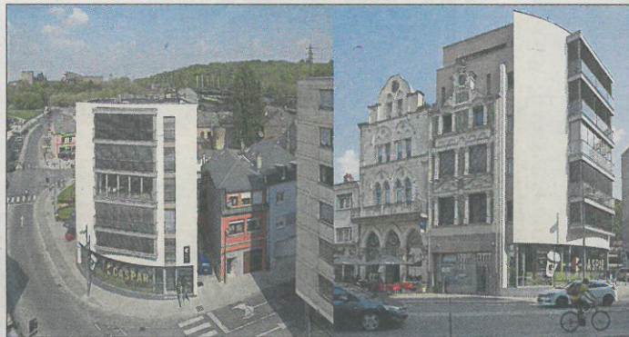
Immeuble mixte equinox, Esch-sur-Alzette. Architecte: Beng architectes associés sa. Ingénieur-Conseil: Goblet Lavandier & Associés