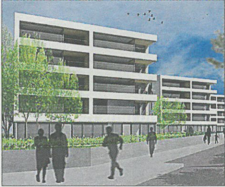
Logements quartier du Grünewald, Kirchberg. Architecte: Steinmetzdemeyer. Ingénieur-Conseil du génie technique: Dal Zotto & Associés sàrl. Ingénieur-Conseil du génie civil: T6 - Ney & Partners sàrl

L'exposition présente des solutions innovantes de membres OAI dans le domaine du logement