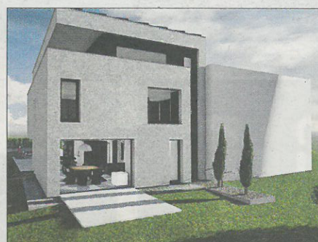
Maison unifamiliale, Redange-sur-Attert. Architecte: Ai + sàrl