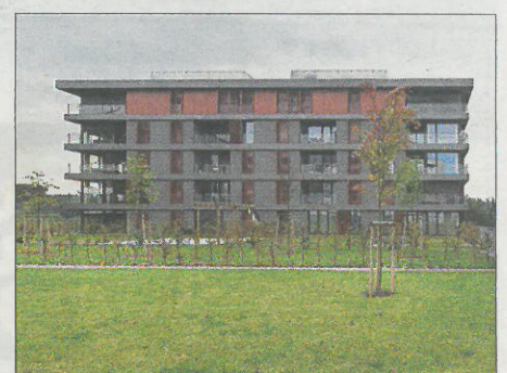
Résidence, Kirchberg. Architecte: G + P Muller architectes sàrl