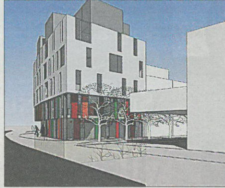
Immeuble Kennedy, Esch-sur-Alzette. Architecte: Steinmetzdemeyer. Ingénieur-Conseil du génie civil: Best Ingenieurs-Conseils sàrl. Ingénieur-Conseil du génie technique: BLS Energieplan Ingenieurs-conseils sàrl