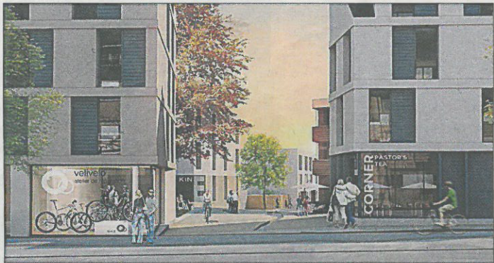
Lotissement «Le Verger Ermesinde» - Vivre Sans Voiture Limpertsberg. Architecte: Fabeck architectes sàrl. Architecte-Paysagiste; Ingénieur-Paysagiste: Mersch Carlo