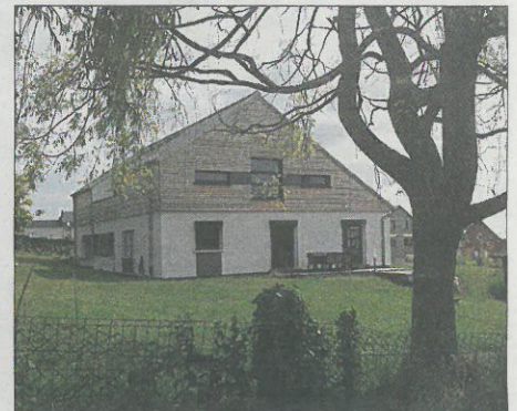
Transformation d'un bungalow unifamilial en maison bifamiliale Welfrange. Architecte: FG architectes sàrl