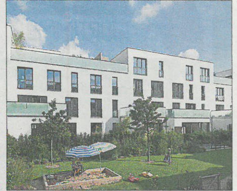
Höfe im Hof, Cologne, Allemagne. Architecte: Dewey Muller architectes et urbanistes. Ingénieur-Conseil du génie civil: Stracke Ingenieurgesellschaft mbH. Ingénieur-Conseil des autres disciplines: Energiebüro vom Stein.