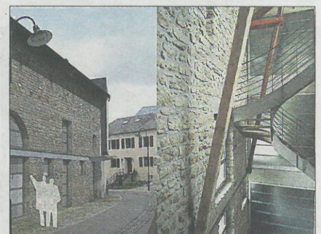
Aménagement d'un loft dans une ancienne dépendance, Luxembourg. Architecte: Berbec Stanislaw