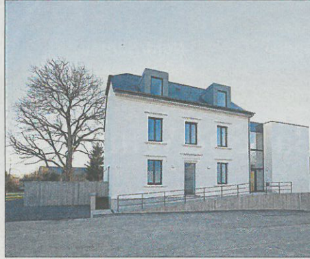
Transformation de la maison «Bicheler», Mondercange. Architecte: Metaform Architecture. Ingénieur structure: Simon & Christiansen. Ingénieur-Conseil du génie technique: Goblet Lavandier & Associés