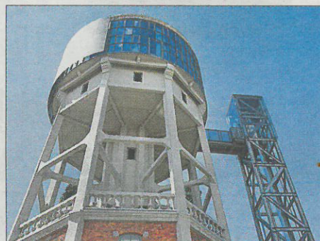
H2O-Rénovation d'un château d'eau, Bruxelles-Forest, Belgique. Architecte: Paczowski et Fritsch