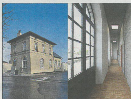
Logements étudiants, Noertzange. Architecte: A + T architecture sa