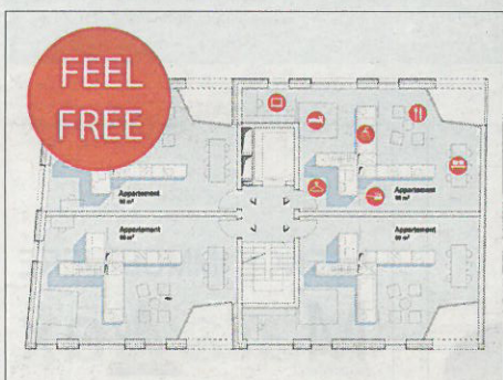
Résidence de dix logements, Schiffflange. Architecte: Team 31